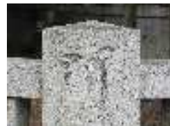
まだ花粉症？ (白山神社、北西角)