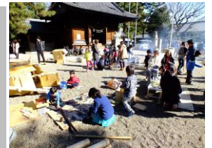
毎月16日の白山神社境内 あんじょうプレーパーク

◎ 組総会には全世帯参加しよう 組長連絡会開催 1月17日(日) 午前10時 60人 今村公会堂 本年度も残り2ヶ月、28年度に向けての各組役員を選出や、町内会長及び改選評議員の信任投票及び引継ぎ文書提出について、組長さんに依頼をしました。各組総会は、地元の声を市政に反映させ、地域の課題を皆さんと協議するよい機会です。是非、是非、組総会に参加してください。